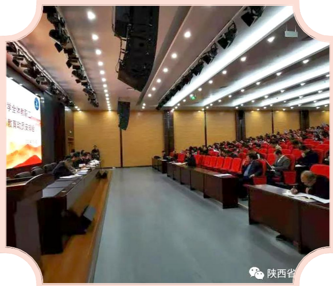
(文字:高锦霞)

共同思想根基、打造高素质教师队伍等方面,深刻认识党史学习教育的重大意义,高标准高质量落实好各项任务;要抓好本年度党史学习教育内容的深入开展,坚持学习党史与学习新中国史、改革开放史、社会主义发展史相贯通,做到学史明理、学史增信、学史崇德、学史力行,不断提高政治判断力、政治领悟力、政治执行力,为我校名校建设筑牢思想基础。 党史学习教育必须以党员干部为主体覆盖全体师生的教育整顿的全过程;切实增强开展好党史学习教育的思想自觉、政治自觉、行动自觉,高标准高质量落实好各项任务,确保取得实实在在的学习教育成果,将学习教育中激发出来的工作热情和进取精神转化为教育工作的强大动力,以更加优异的成绩献礼建党100周年。